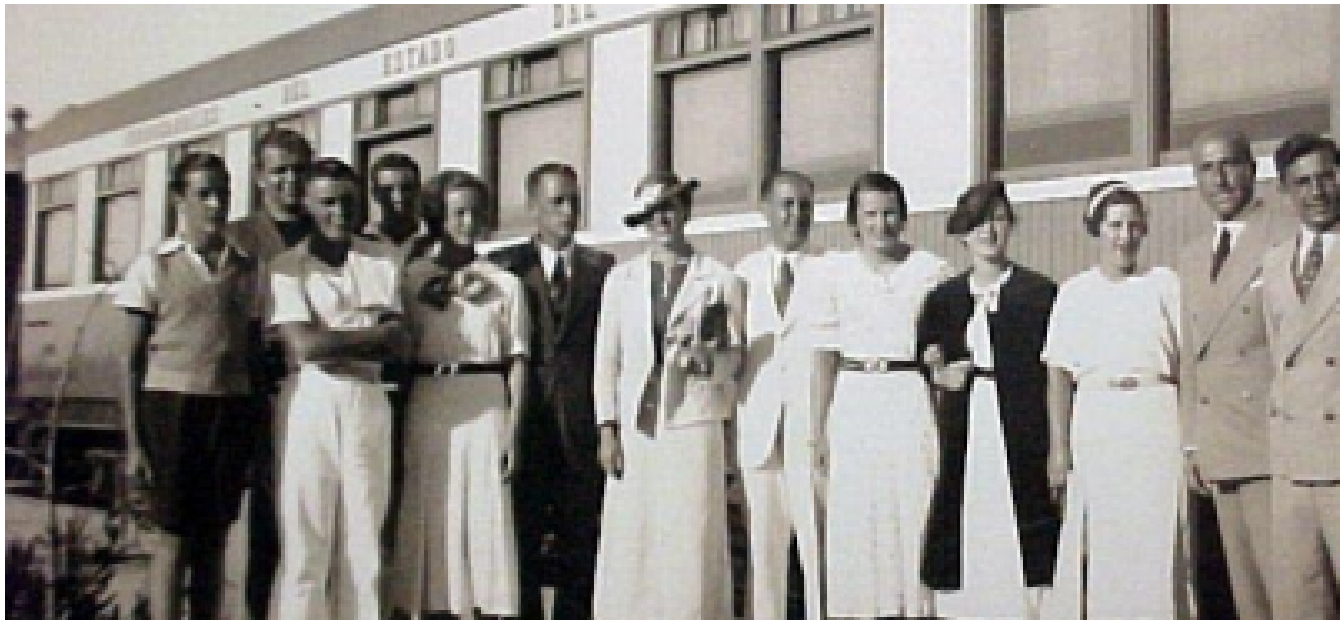
Viajeros del tren.