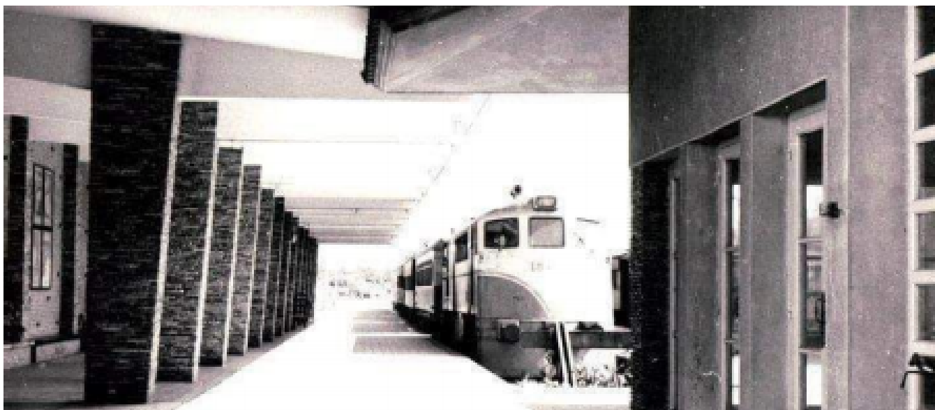
El Tren en la Estación de Punta del Este.