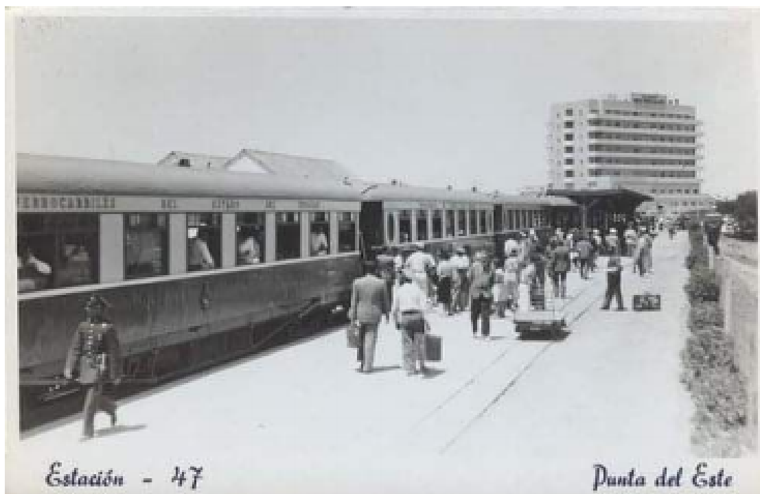
Antigua Estación de trenes (1947).

Docentes Área de Estudios Turísticos (CURE)