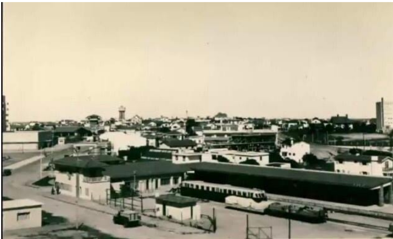
Vista aérea Antigua Estación de Trenes.

En buena parte del siglo XX (1935-1991) en el contexto de una lenta construcción de comunicación terrestre y acelerada expansión del turismo, surgen cooperativas de transporte de autobuses vinculadas al traslado de pasajeros, es así que transitó por todos los departamentos del territorio uruguayo, la empresa cooperativa de autobuses ONDA (Campodónico y da Cunha, 2010).