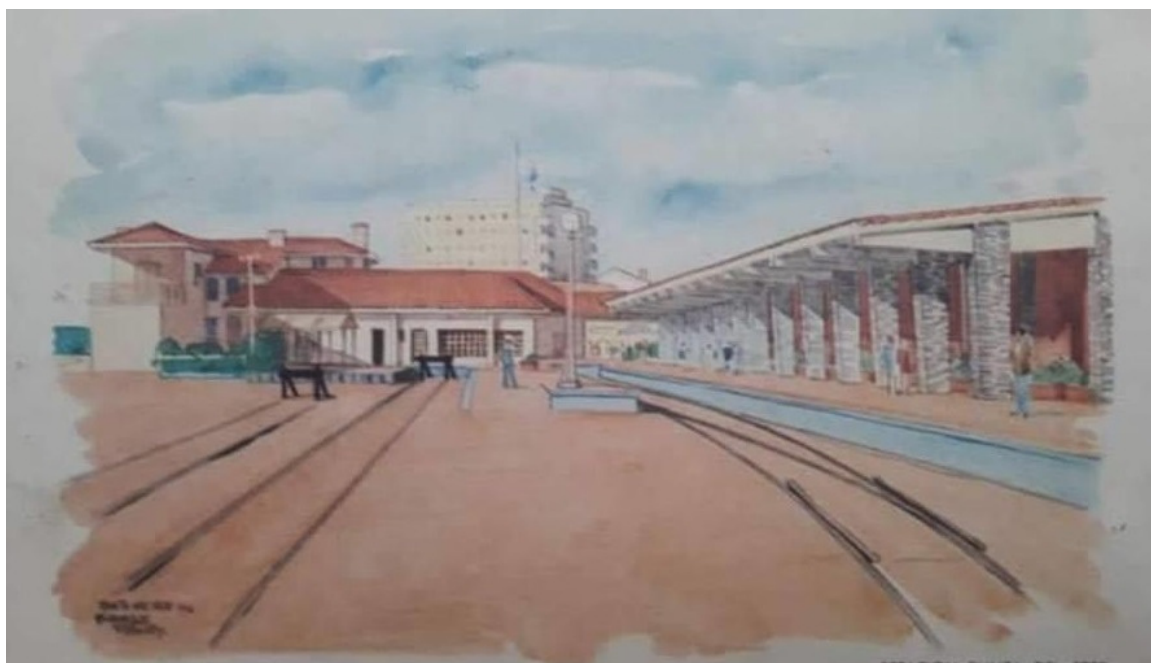
Dibujo en acuarela de Estación de Trenes. Fuente: Ilustración de Pierre Fossey

En su relato recordó dos trenes que eran los más confortables, el Águila Blanca y el Águila Azul, el viaje duraba entre tres y cuatro horas. Los trenes tenían dos vagones, el de primera, que era más lujoso y caro el ticket (ella nunca viajó allí) y el de segunda que era más barato, transportaban pasajeros y realizaban encomiendas, generalmente desde Montevideo. Se ofrecía servicio de cafetería y a Nancy le encantaba tomar Malta. Recuerda a Doña Urbana, quien era una señora que vivía frente a la estación, encargada de levantar y bajar las barreras para el tren con una manija de metal que se giraba. Hubo discusiones cuando se quiso retirar el servicio ferroviario, algunos de los motivos fueron el corte de tránsito dada la localización de la estación, la zona se había precarizado y se encontraba sucia.