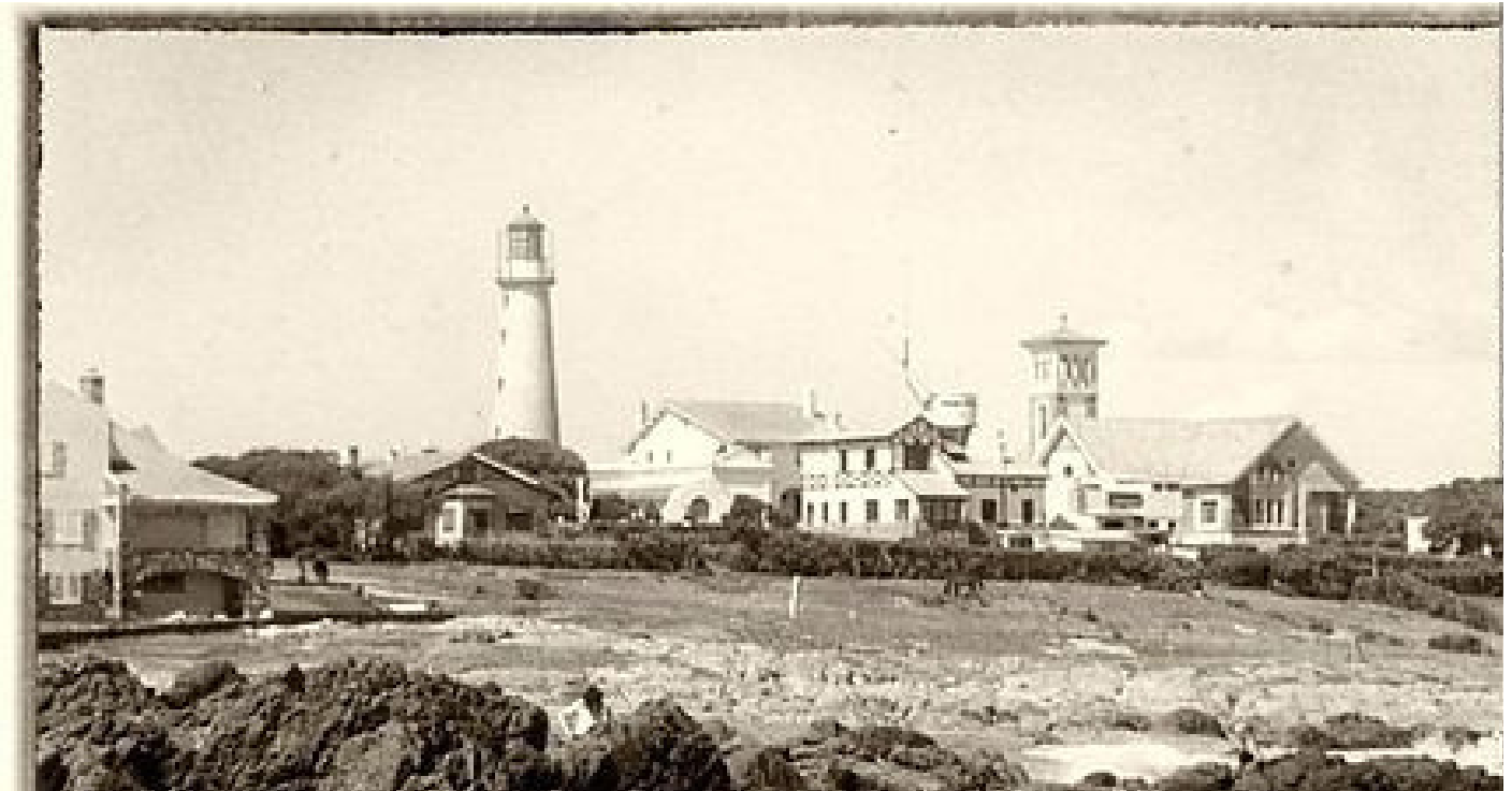
Antigua imagen de la península y el Faro.

Docentes Área de Estudios Turísticos (CURE).